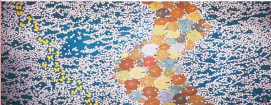
旧、中日劇場 緞帳 (一部展示予定)

日 時: 11月17日(土)~24日(土) 10:00~16:00(期間中休まず開館) 場 所: 愛知大学豊橋キャンパス 愛知大学記念館