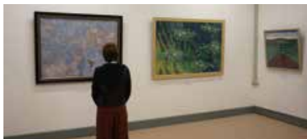
名誉博士記念室 (前回開催時の様子)