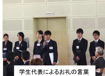
学生代表によるお礼の言葉