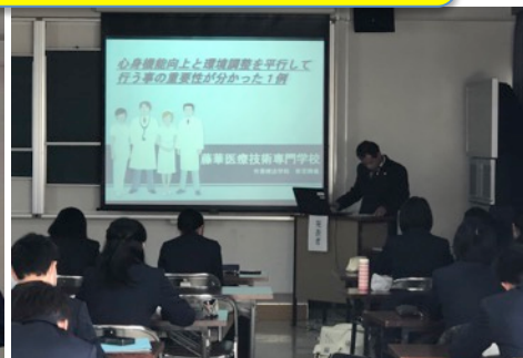
3年生は思い思いのテーマで実習中の患者さんとの関わりについて発表しました。