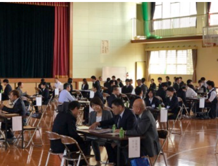
ブース形式での開催です。学生は事前に施設からいただいた情報を元に興味のある施設のブースに行き、お話を伺っていました。