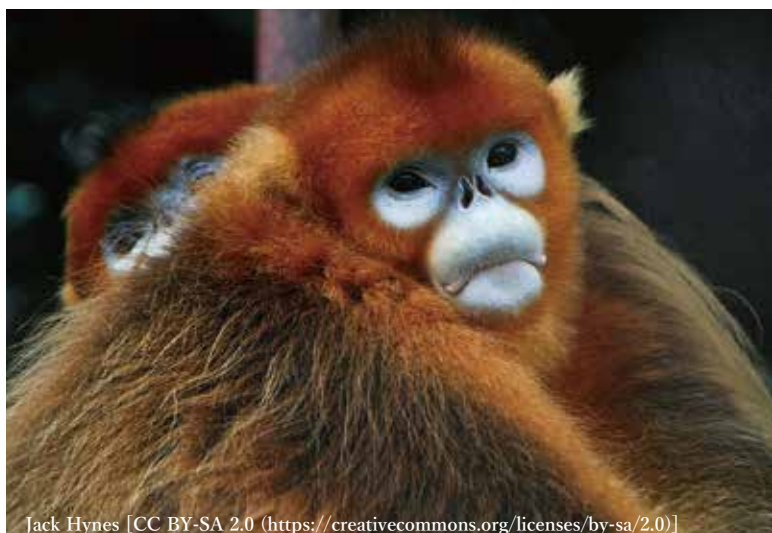
Jack Hynes [CC BY-SA 2.0 (https://creativecommons.org/licenses/by-sa/2.0)]